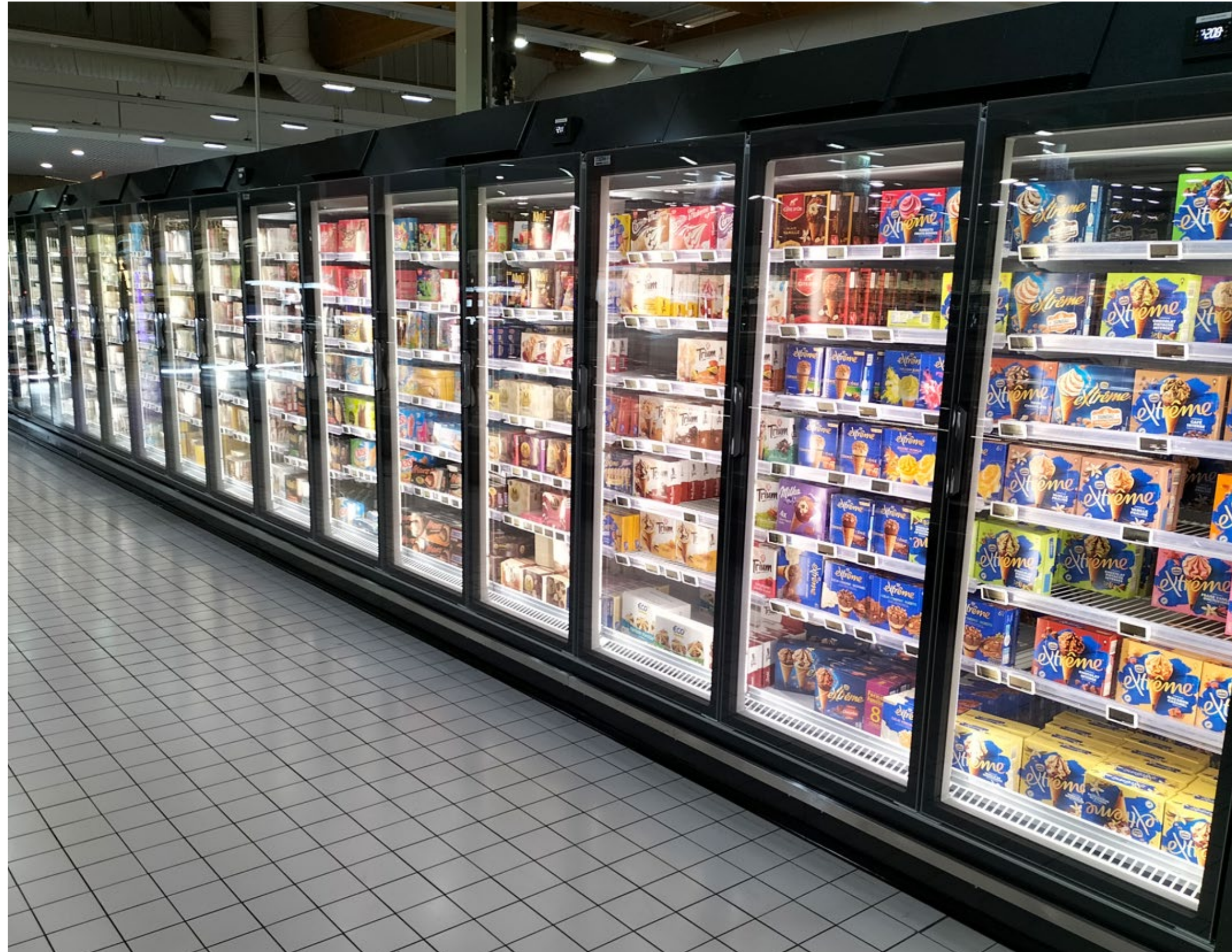
SkyLight Integral Perform lineal de 17 puertas