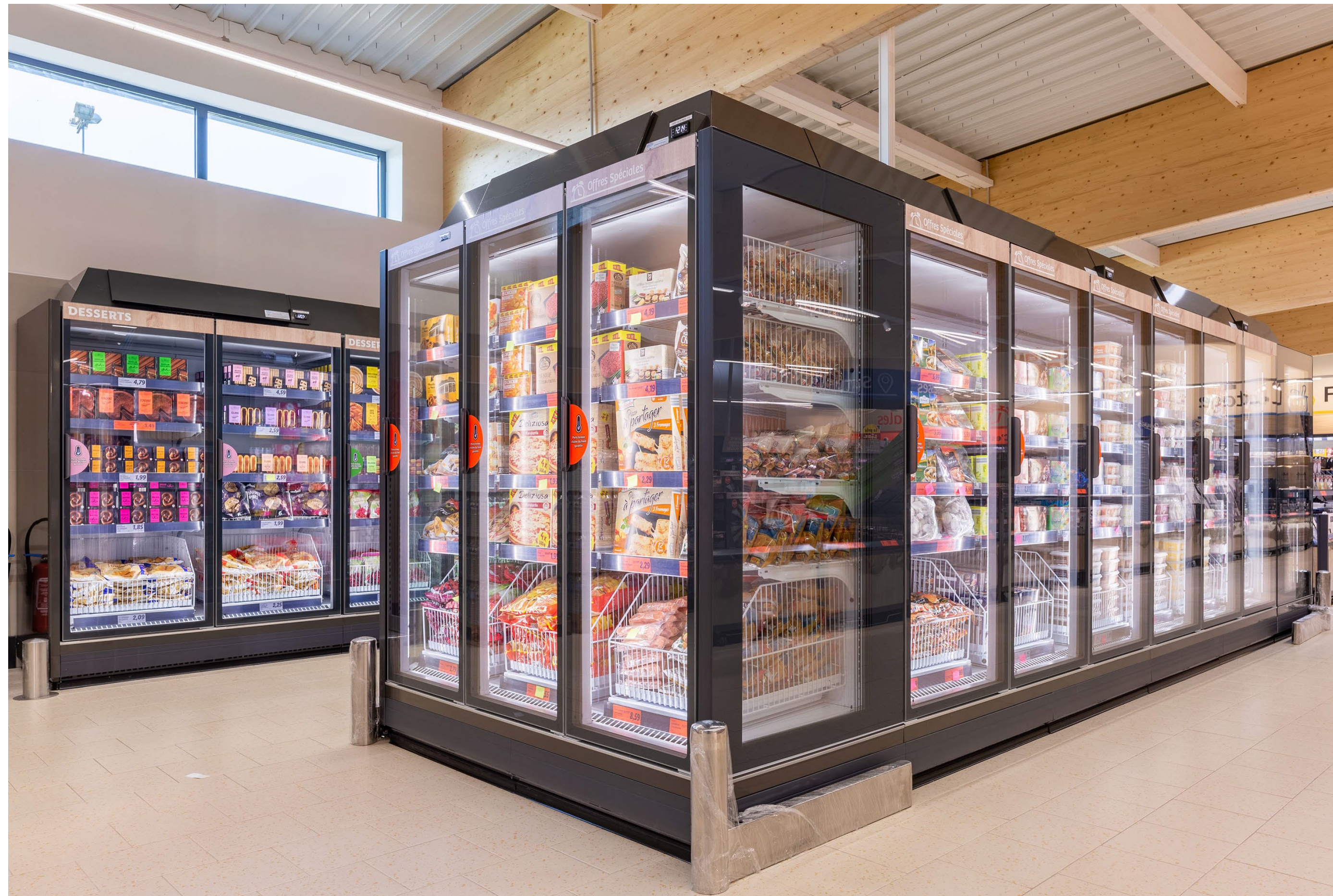
SkyLight Integral Perform isla con final de línea 3DS