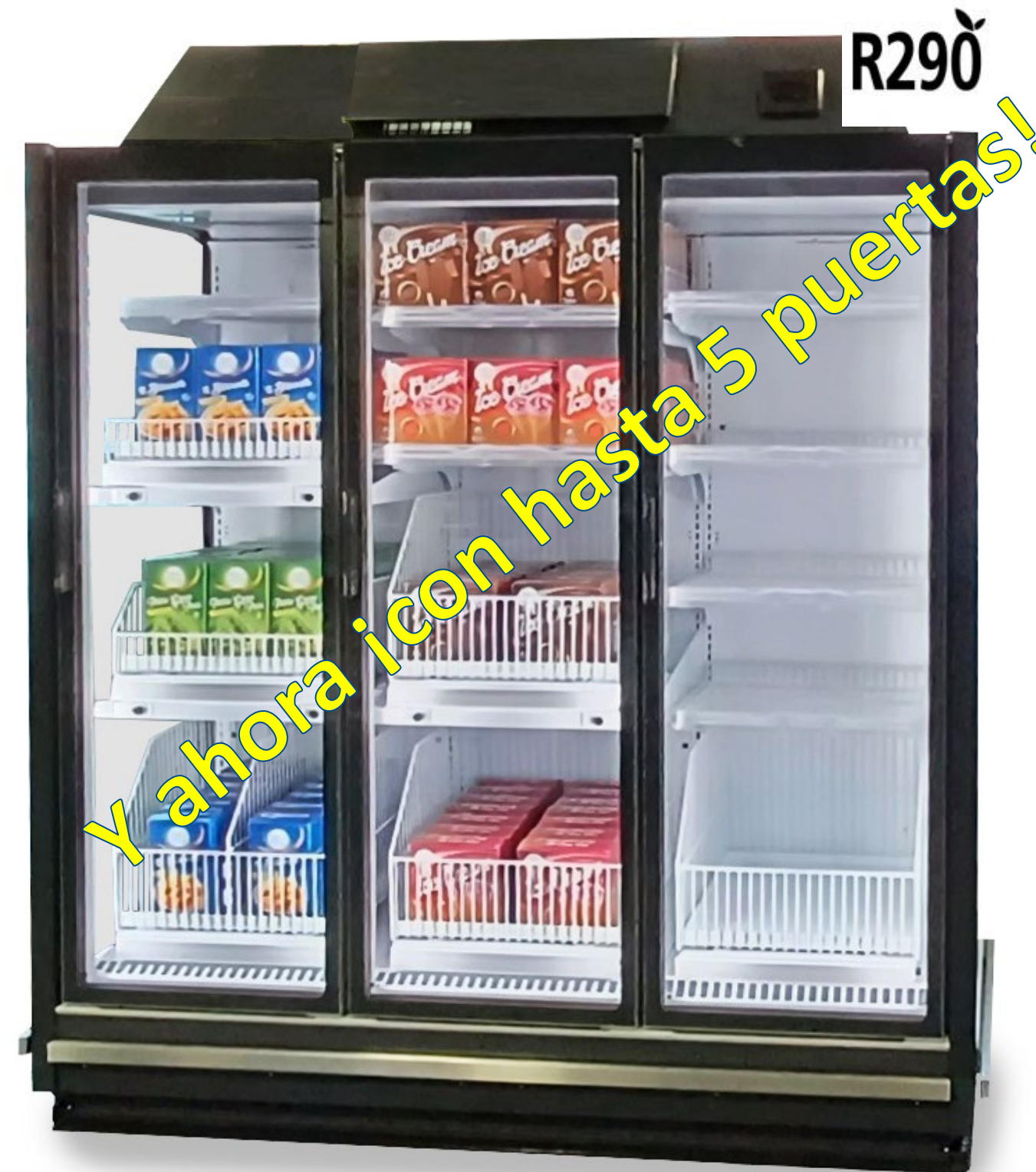
Nuevo SkyLight Integral Perform

En comparación con la generación anterior, SkyLight Integral Perform ofrece hasta un -30% de ahorro de energía , más soluciones inteligentes de presentación y una mayor oferta de personalizaciones .