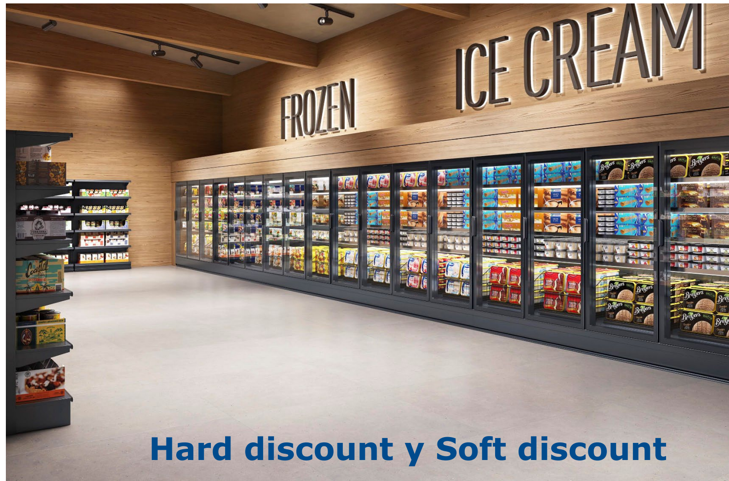
Hard discount y Soft discount

SkyLight Integral Perform se enfoca a todas las actividades minoristas