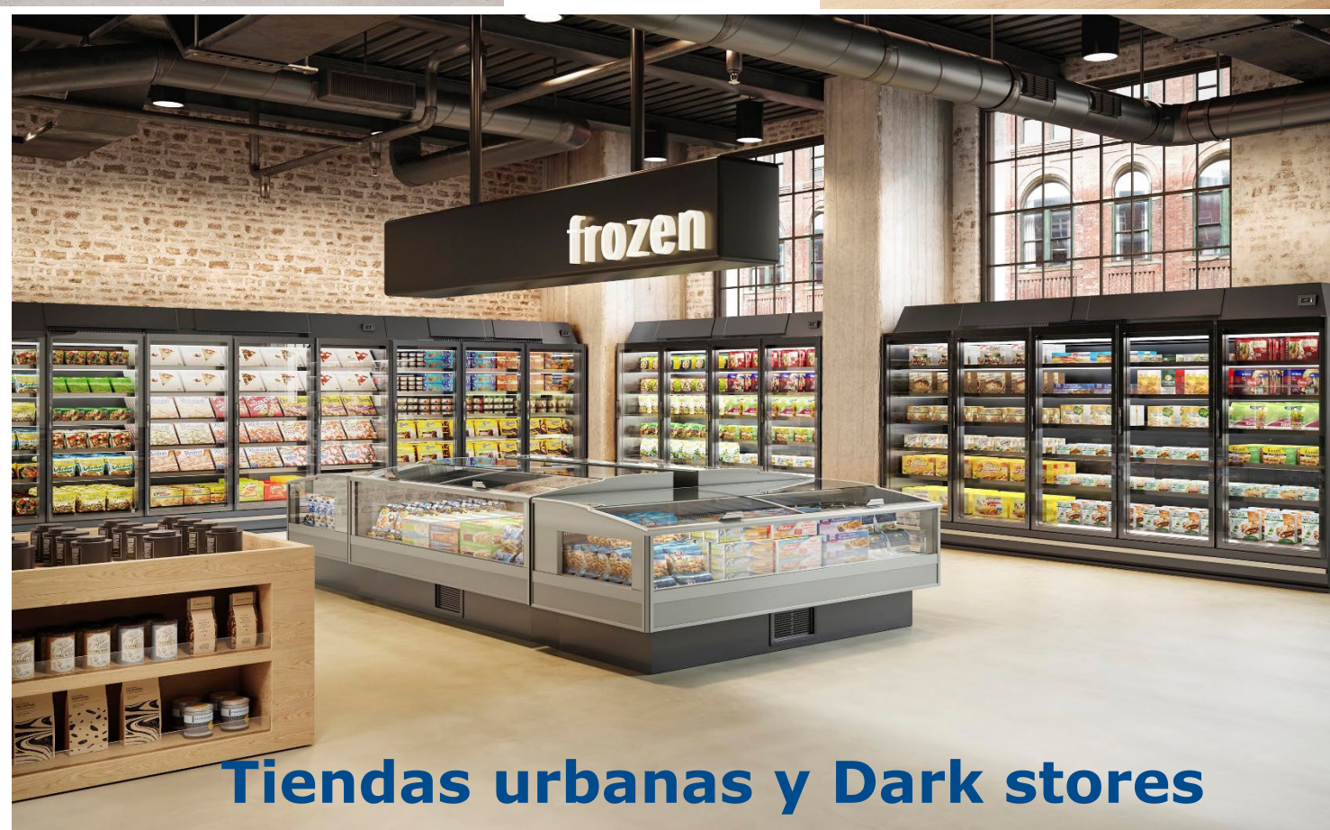
Tiendas urbanas y Dark stores